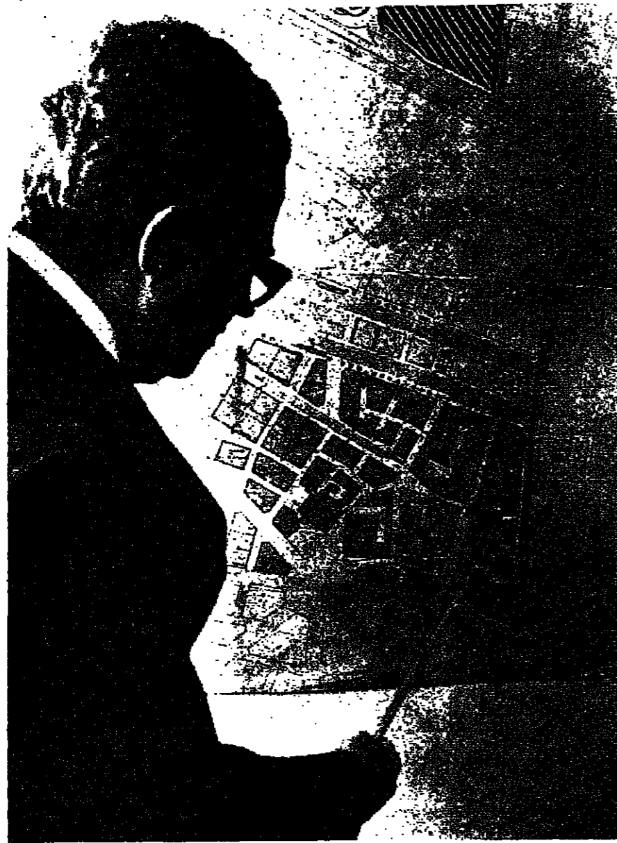
المحافظ يشرح خطة التعمير على خريطة